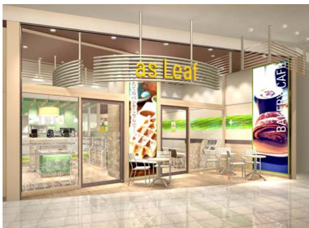
(東京店 店舗ファサード)

パンを愉しむための“something good”(何かいいもの)をテーマにしたベーカリーショップです。ブレッドジャーナリスト清水美穂子氏をアドバイザーに迎え、これまでも、商品を開発しており、自身の著書である「日々のパン手帖～パンを愉しむ something good」(メディアファクトリー発行)から生まれた商品も多数あります。