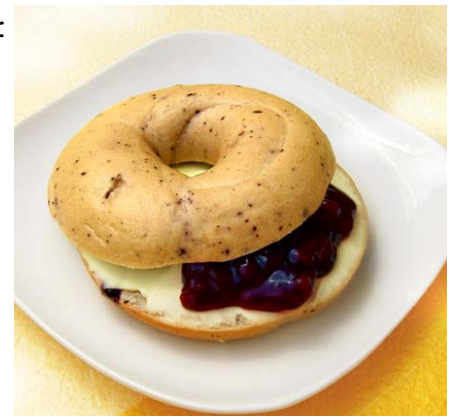
ベーグルサンド 360円／ハーフ 180円