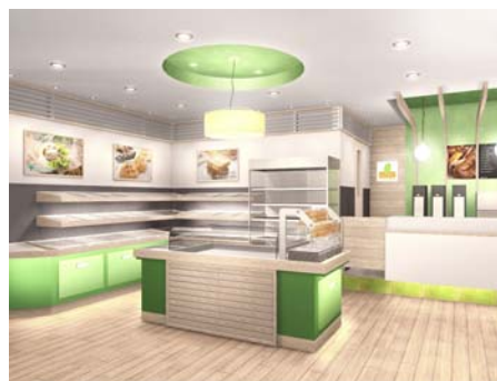
アズリーフ浜松町店内装イメージ